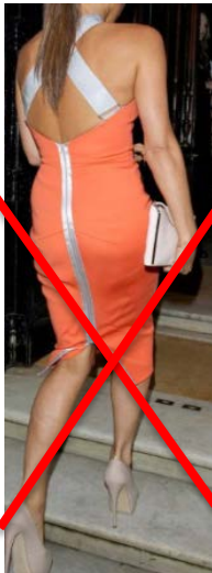
Epaules nues talons trop hauts