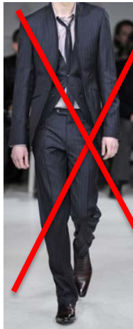
cravate non serrée