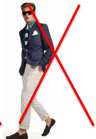
Pas de chaussettes Port de lunettes de soleil