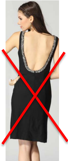
Décolleté trop profond