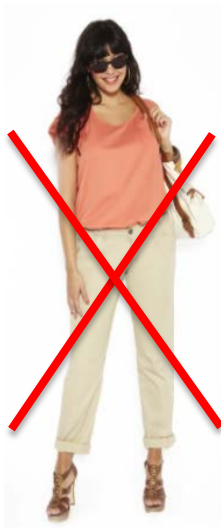
Pantalon chino, chaussures ouvertes, lunettes de soleil