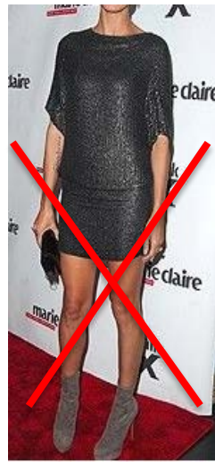
Jupe trop courte, bottines avec une robe