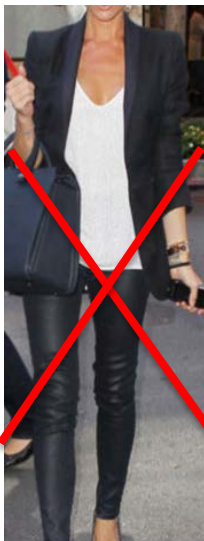
Pantalon en cuir