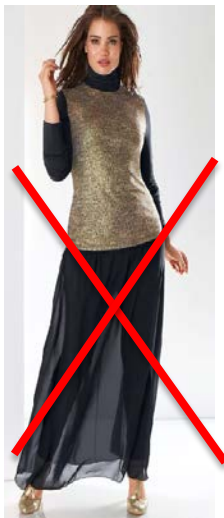
Jupe longue et transparente