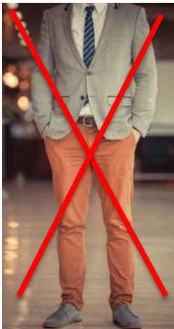
Pantalon chino sans pli